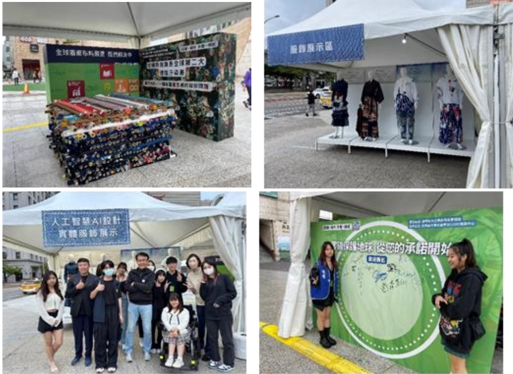
內科園區永續時尚周推廣