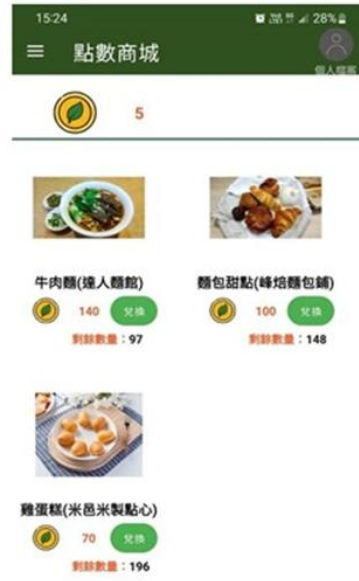
累積碳幣可至合作商家兌換商品