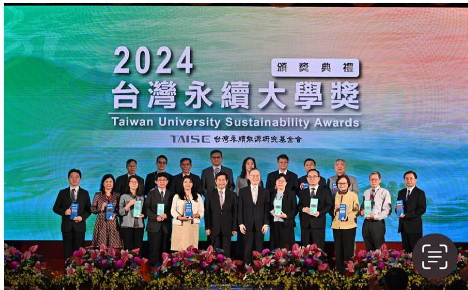
台灣永續大學獎[環境管理管理獎]