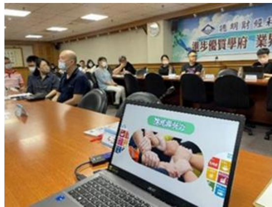
台灣綠色紡織品聚落(TG)2 成立大會