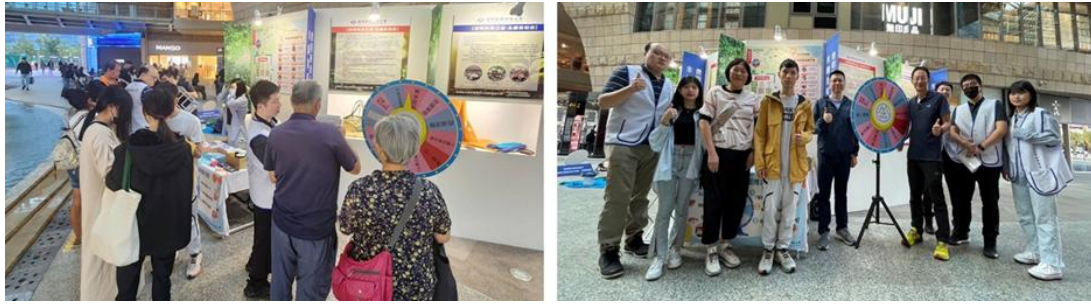
金面山西湖商圈共榮推廣活動