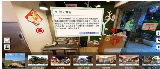
協助 12 家西湖商圈導入-虛擬門市系統