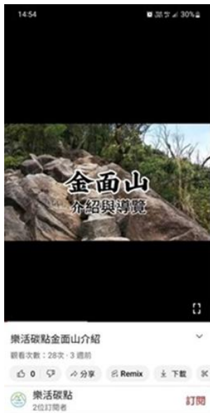
金面山 介紹與導覽