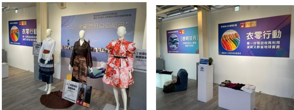
辦理中原文創基地的永續展