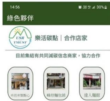
介紹綠色夥伴廠商 (認同樂活碳點 APP 推廣理念)