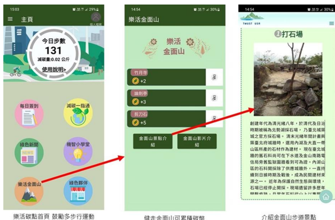
樂活碳點 APP 介紹

環境永續亦是校園治理重點之一。本校積極推動「德明生態綠校園」行動，自 108 年度起累計植栽超過 800 株，綠覆率提升至 22%，預估年減碳量達 6.5 公噸 CO 2 e。透過節能建築導覽、碳足跡教案與碳點 APP 開發，學生能在行動中理解氣候議題並對應 SDG 13（氣候行動）與 SDG 15（陸域生態）。