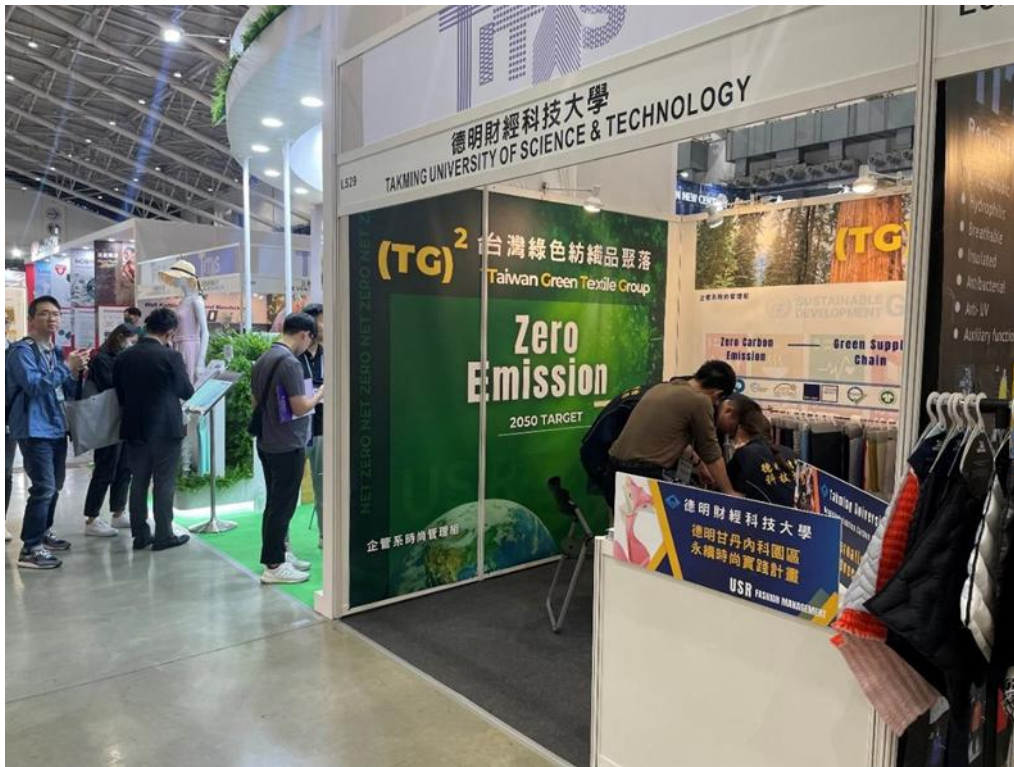
繼台灣綠色紡織品聚落(TG)2 參加 TITAS 台北紡織展

另據平台統計，至 113 年底累積提供布料超過 20,000 碼、服務記錄超過 350 次，估計節碳效益達 50 萬公斤 CO 2 、節電達 100 萬度，對於推動地方碳治理與紡織減碳具高度示範性。